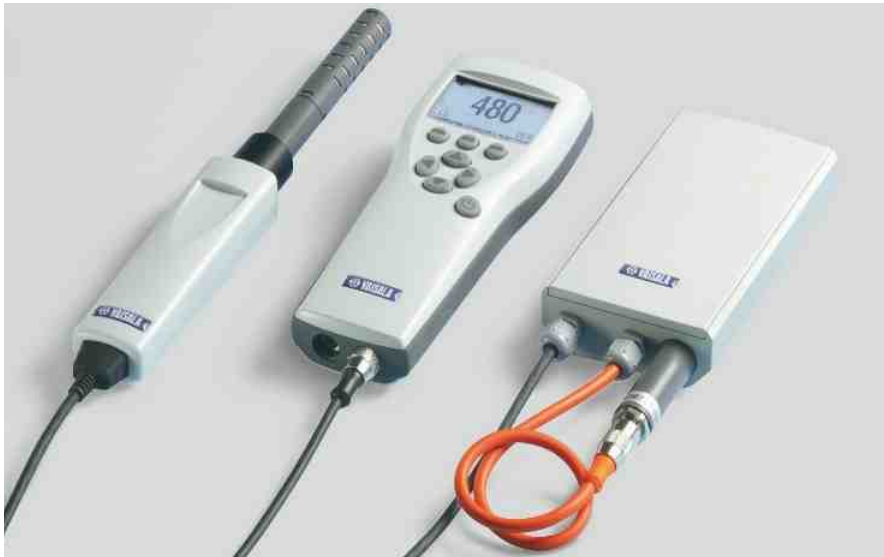
Das portable Vaisala CARBOCAP™ CO 2 -Messgerät GM70 ist robust aufgebaut und besteht aus Anzeigegerät (Mitte) und Sonde, entweder in Verbindung mit dem Handgriff (links) oder der Membranpumpe (rechts)