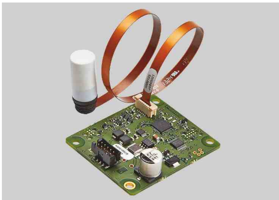
维萨拉HUMICAP®数字湿度模块HMM105。