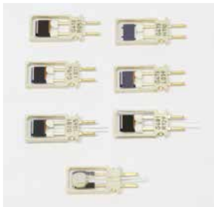
Famille de capteurs HUMICAP.

isolateurs - utilisés pour manipuler les matériaux sensibles à l'humidité ou aux gaz - bénéficient de la précision et de la fiabilité des mesures de l'humidité. Il est parfois particulièrement difficile de mesurer l'humidité dans un environnement critique.