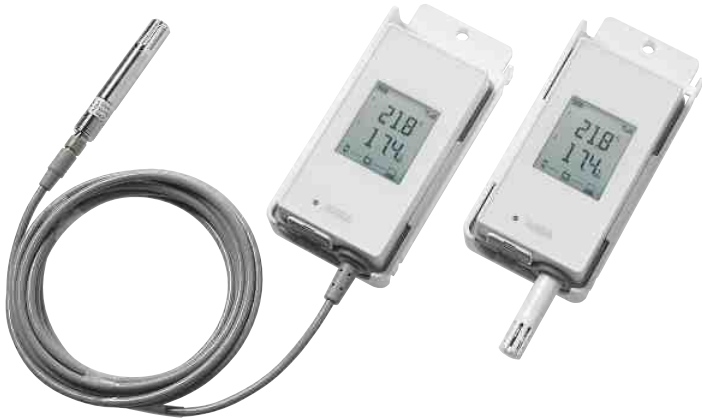
Langaton VaiNet RFL100 dataloggeri lämpötilan ja kosteuden langattomaan mittaamiseen valvotuilla alueilla.