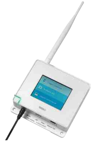
Langaton VaiNet AP10 tukiasema VaiNet RFL-sarjan dataloggerien verkottamiseen.